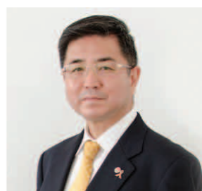
運営会社 株式会社ベストライン 代表取締役社長

◎土地や住まいの購入や建築などは、一番最初のお客様の欲求...例えば「こんなところに住みたい!」「今よりも広い住まいに暮らしたい!」など。その発想の次点での進め方が一番大切になります。 ◎「住まいの道咲き案内人、住まいのいろは」は、どこの地域の土地に住んだらいい?、今よりも家族が増えるので、住み替えたい!、住まいは欲しいけど支払いが心配...などのお悩みに対し、お客様の置かれている状況を把握し、親身にご相談、ご提案をさせていただきます。 ◎弊社では、どこの建築会社で建てたらいいのかわからない? というご相談にも、お客様のニーズに合わせて第三者的な立場で、建築メーカー様、工務店様などのご提案をさせていただきます。